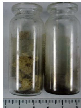
Емкость для приготовления раствора наркотика (также об употреблении наркотиков свидетельствует маленькие ватные шарики, которые используются при заборе раствора в шприц).