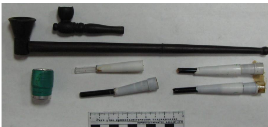
Курильные приспособления для употребления наркотических веществ