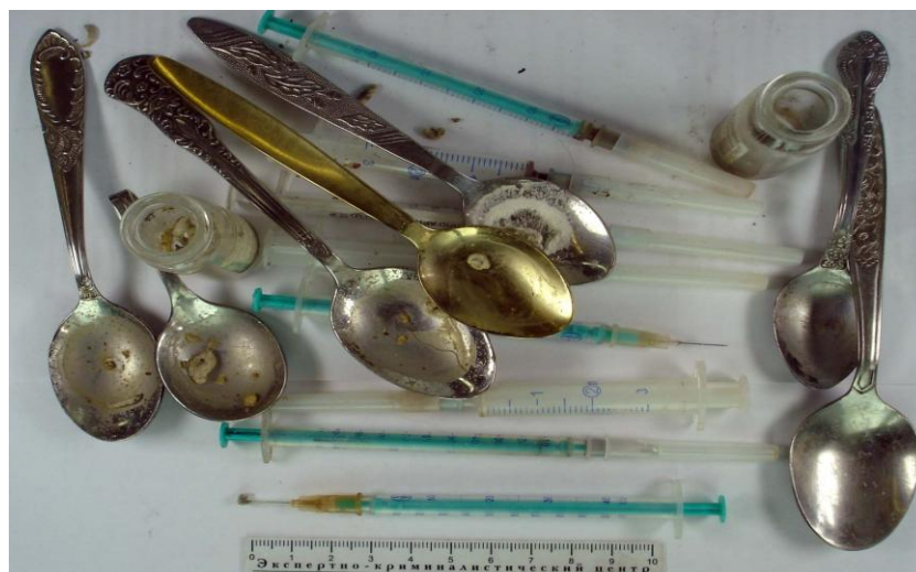
Предметы для приготовления и инъекционного употребления наркотических веществ