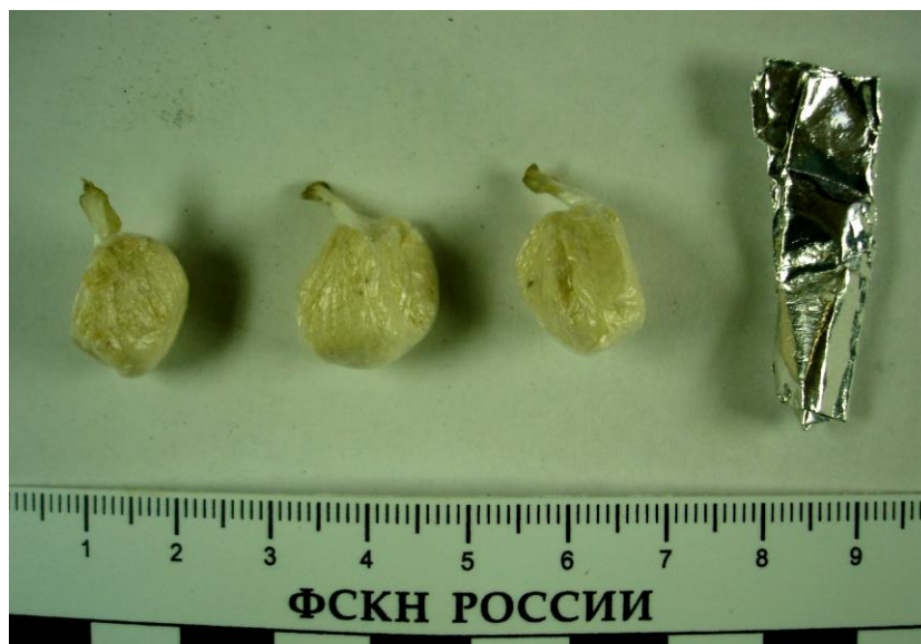
Наркотик в расфасованном виде (фольга, полиэтилен)