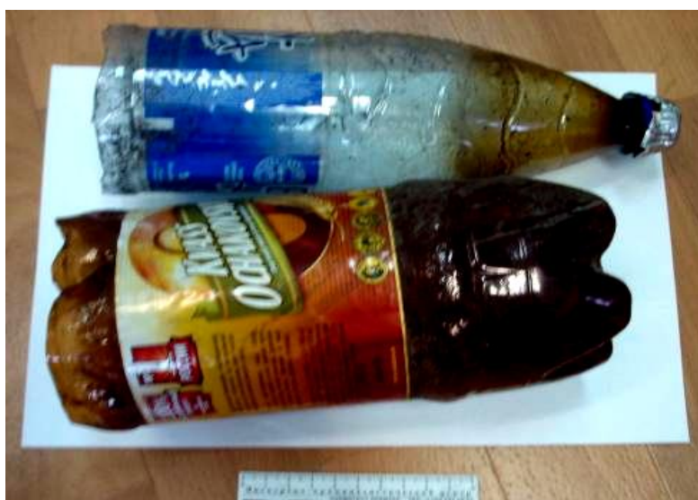
Самодельные приспособления для курения наркотических средств