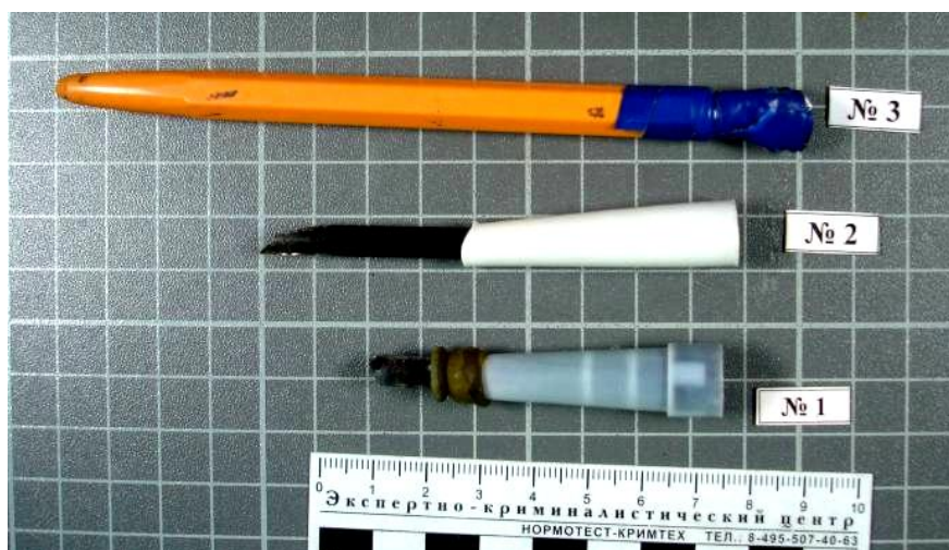
Самодельные мунштуки для курительного употребления наркотических средств