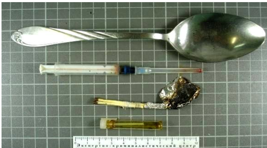
Предметы для приготовления и инъекционного употребления наркотических веществ